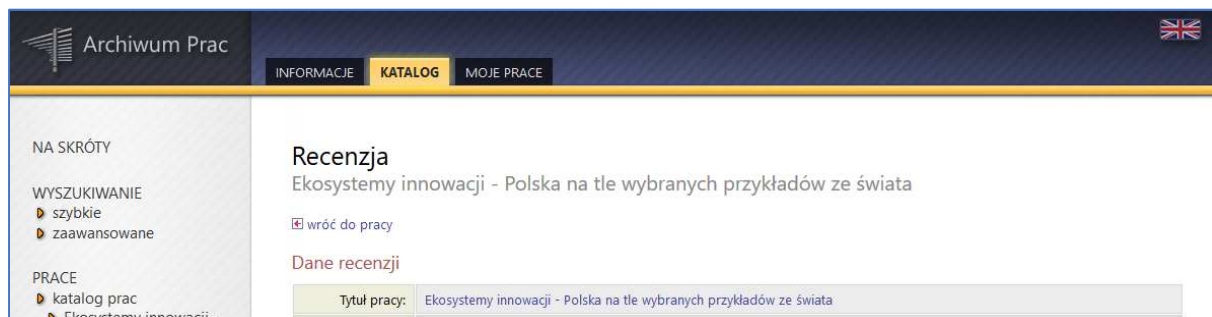
Rys. 6 Ekran Recenzja

W sekcji Treść recenzji znajduje się plik pdf z naszą recenzją. Po kliknięciu „ pobierz wersję pdf ”, możemy go otworzyć za pomocą programu Adobe Reader i wydrukować lub zapisać na dysku i wydrukować w innym terminie.