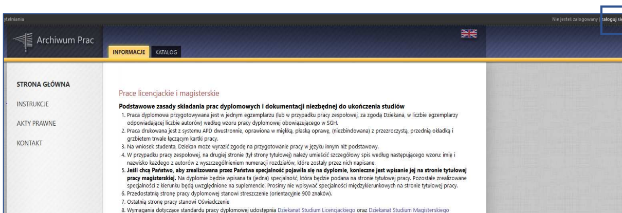
Rys. 1 Logowanie do APD

Na stronie https://apd.sgh.waw.pl w prawym górnym rogu należy kliknąć zaloguj się