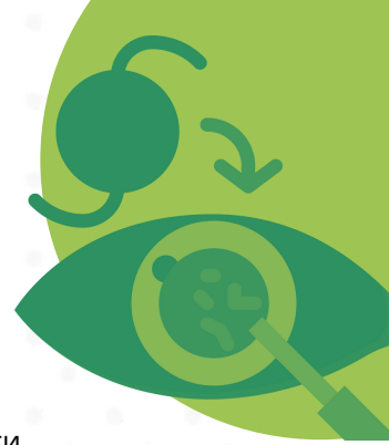
■ к-сть осіб, які отримали послуги хірургічного лікування катаракти

Хороші практики фінансування офтальмологічної допомоги: досвід Польщі, Чехії, Словаччини й Угорщини